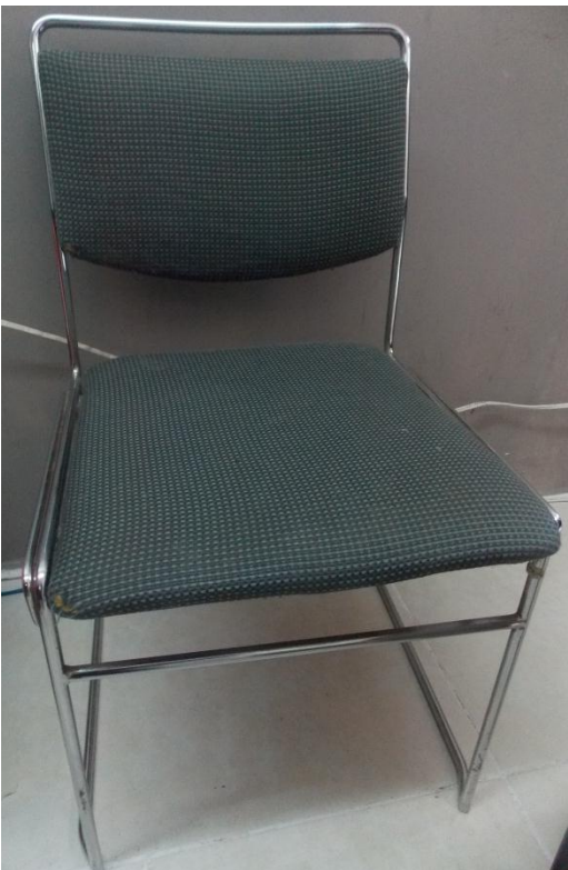
Fotografía 5. Silla para oficina