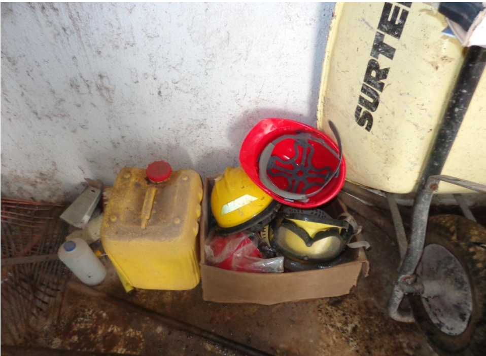
Fotografía 9. Bidón, cascos de bomberos de seguridad, carretilla y araña.