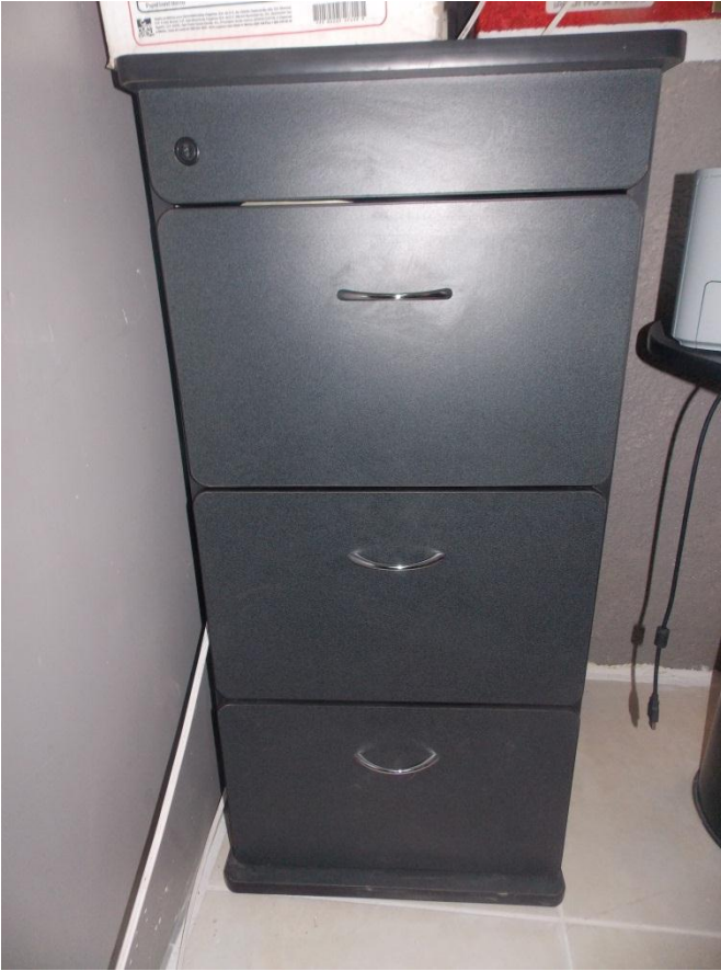
Fotografía 1. Archivero de madera.