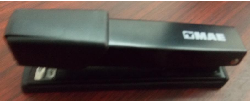
Fotografía 7. Engrapadora.