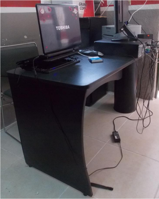
Fotografía 2. Escritorio de madera