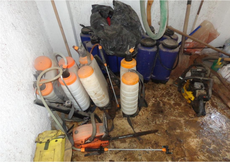
Fotografía 8. Bombas de agua para aspersores