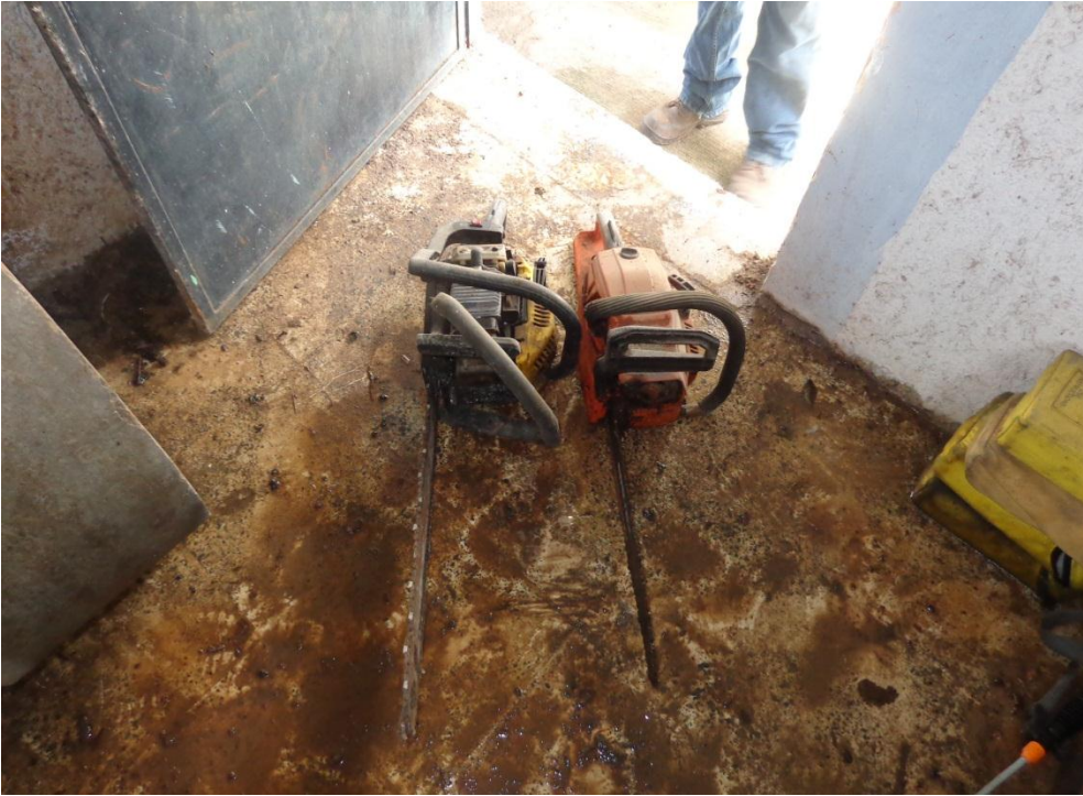
Fotografía 12. Motosierras