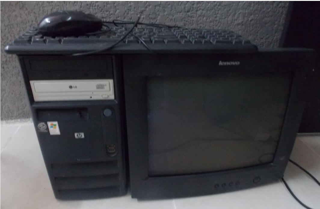
Fotografía 3. Equipo de cómputo. PC, monitor, teclado y mouse.