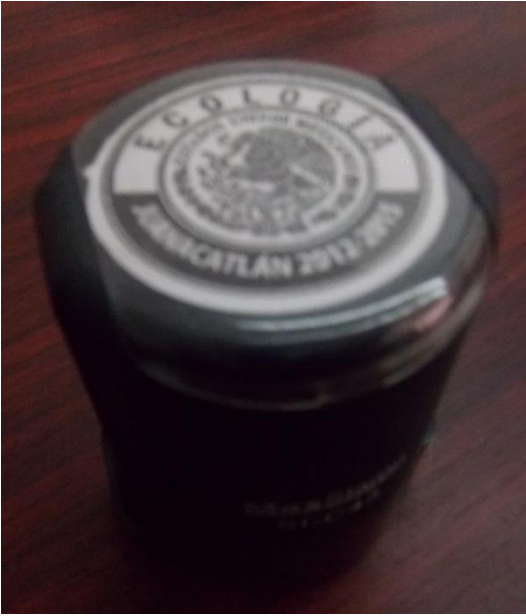
Fotografía 6. Sello gubernamental