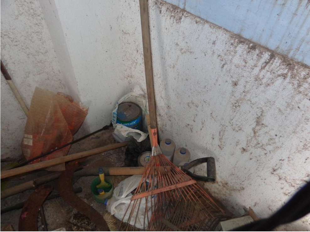
Fotografía 10. Mcleod, rastrillos, lata de pintura y hacha.