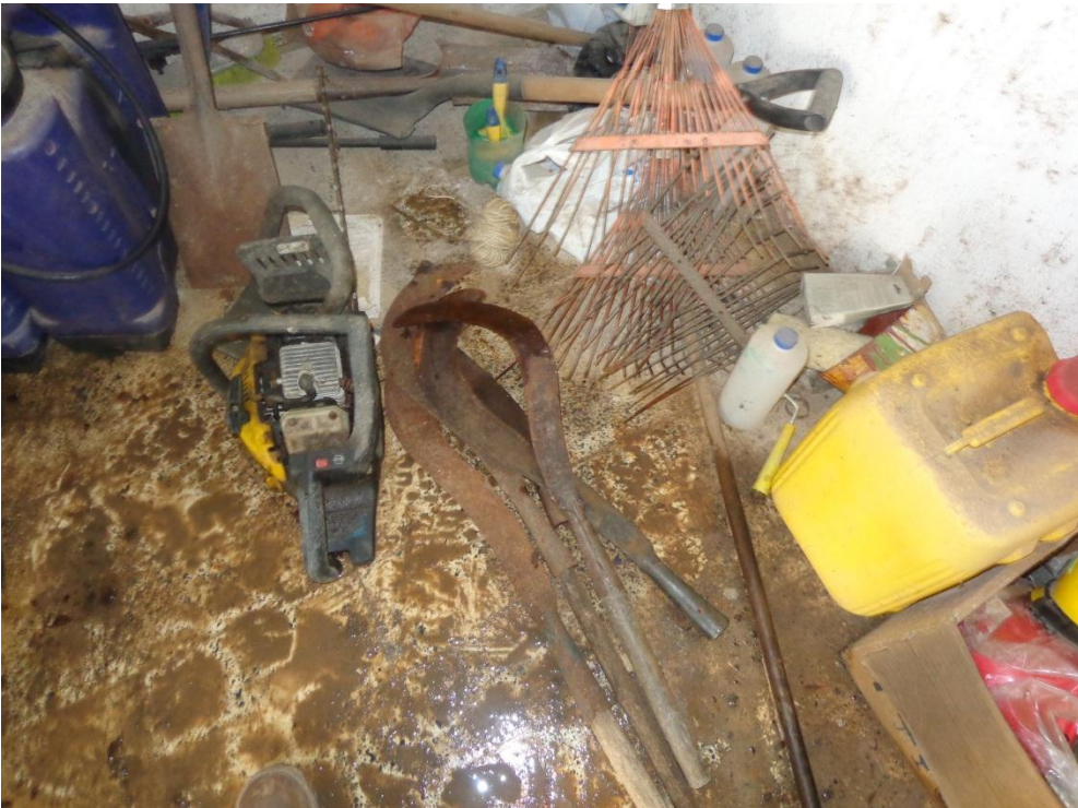
Fotografía 11. Bombas, casangas, azadón, secador de pintura,