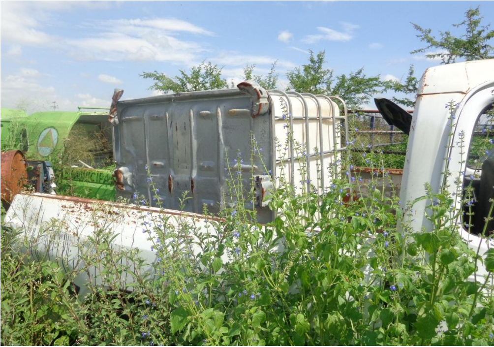
Fotografía 16. Tanque con capacidad de 1000 litros de agua.