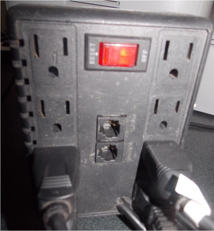
Fotografía 4. Regulador de voltaje