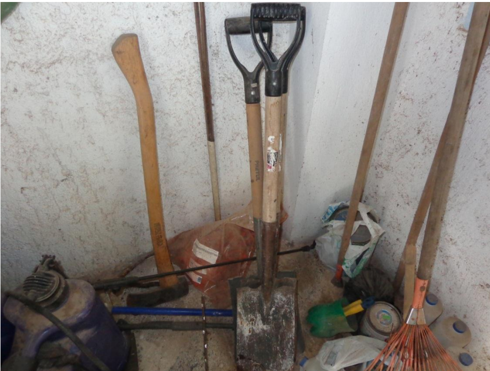
Fotografía 13. Palas, azadón y arañas.