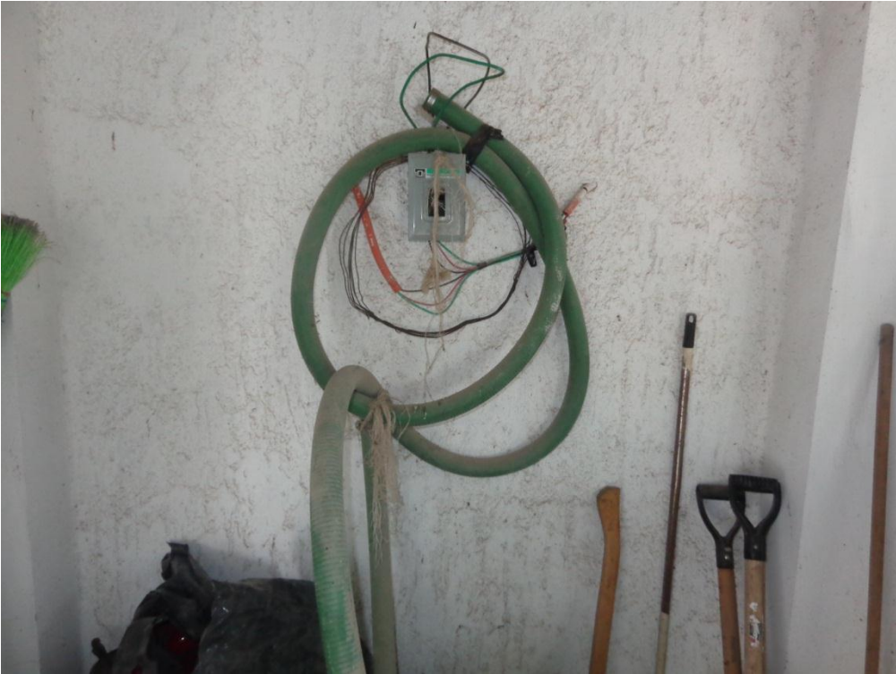
Fotografía 14. Manguera para tanque de agua, jalador de agua y escoba.