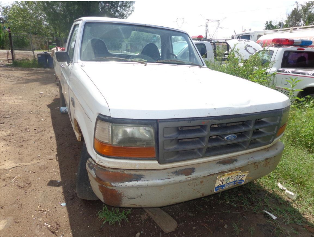
Fotografía 15. Camioneta Ford F150 Modelo 96.